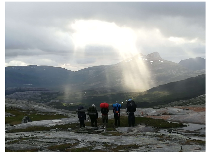
Speiderhaik i Bodø

“Hvis det ikke er moro, er det ikke speiding”